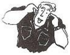
Sam är rolig