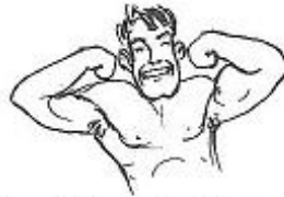
Leif är starkare.