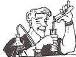
Sam är smartare.