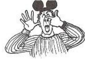
Leif är roligast.